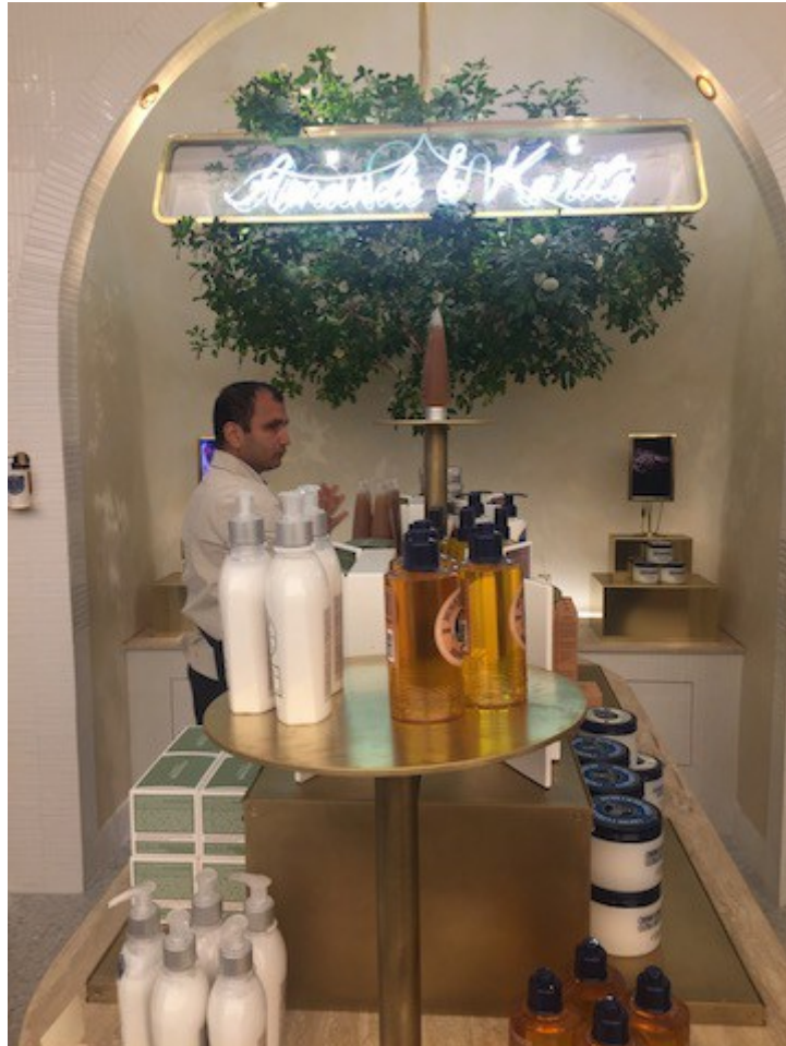
Amande et Karité

les plantes qui constituent les ingrédients principaux de certaines collections.