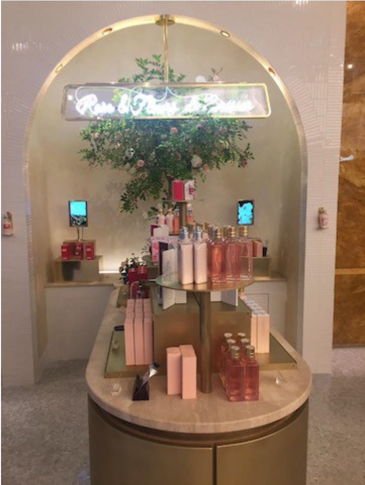
Rose et Fleur de Cerisier